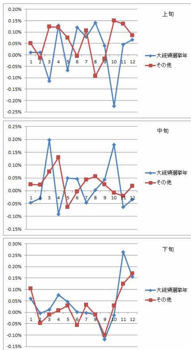
図1. 米国市場における旬別リターンの季節性

統領選挙に伴う政策面での不透明感が嫌気され、投資家の心理にも悪影響を与えている可能性も考慮される。